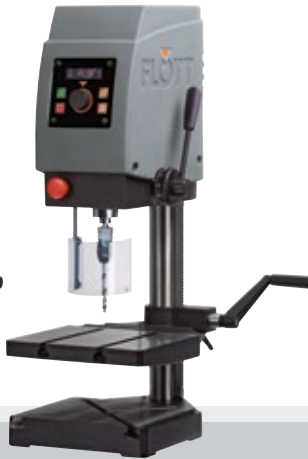
Fig. con opción