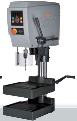
Fig. con opción