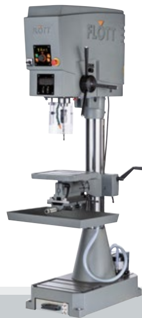
Fig. con opción