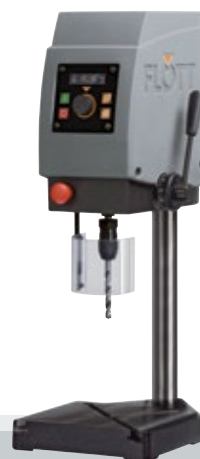
Fig. con opción