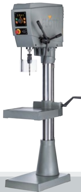
Fig. con opción