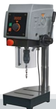
Fig. con opción

(bajo petición, hasta prorrogable hasta 5 años, con recargo)