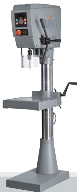
Fig. con opción