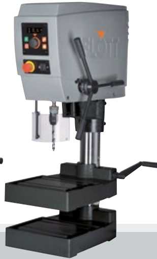
Fig. con opción