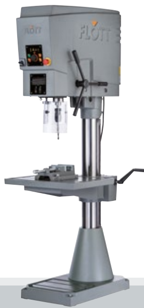
Fig. con opción