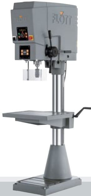
Fig. con opción

(bajo petición, hasta prorrogable hasta 5 años, con recargo)