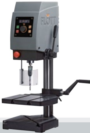
Fig. con opción

(bajo petición, hasta prorrogable hasta 5 años, con recargo)