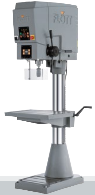
Fig. con opción